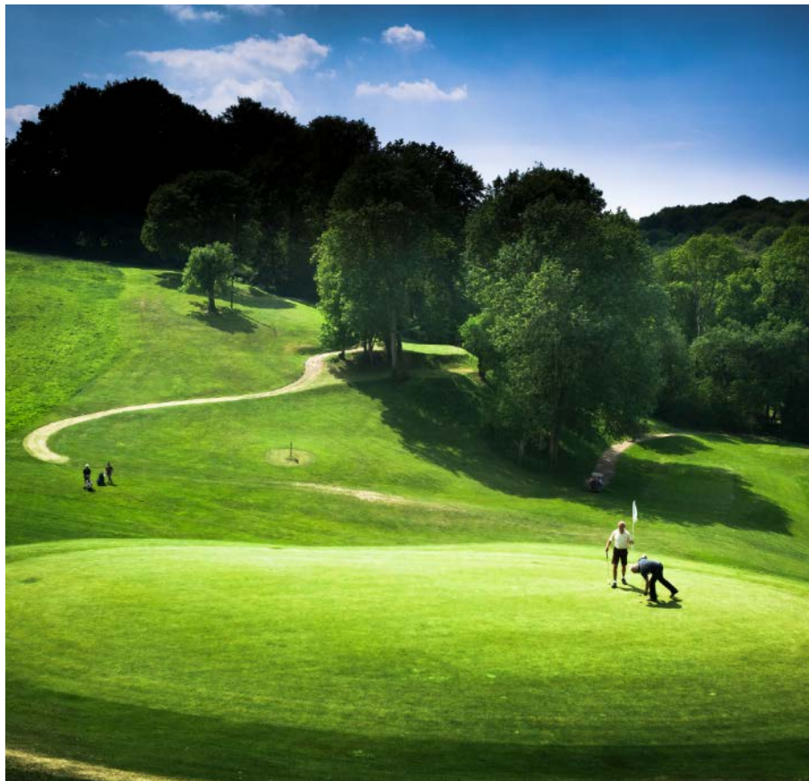
Golfclub Barrière de Deauville

**Ausflüge sind nur im Voraus, alternativ buchbar.